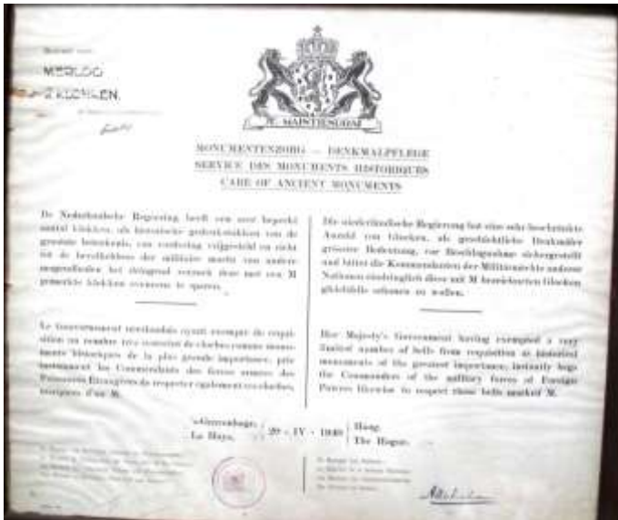
Figuur 1 De tekst op deze oorkonde luidt: “De Nederlandsche Regeering heeft een zeer beperkt aantal klokken als historische gedenkstukken van grootste beteekenis, van vordering vrijgesteld en richt tot de bevelhebbers der militaire macht van andere mogendheden het dringend verzoek deze met een M gemerkte klokken eveneens te sparen.”

Op 21 juli 1943 kwam Rijkscommissaris Seyss-Inquart met de ‘metaalverordening’ op grond waarvan men verplicht werd metalen voorwerpen aan te geven die vervolgens geconfisqueerd werden om omgesmolten te kunnen worden tot oorlogsmateriaal. Op grond van de M-status van de klokken kon voorkomen worden dat de klokken uit de toren werden meegenomen. Dit in tegenstelling tot de klokken van de kerk in Mierlo-Hout die dit lot wel ondergingen.