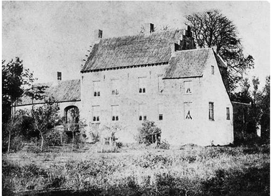
Oudst bekende foto van het kasteel omstreeks 1860

Het middelste gedeelte van het kasteel is gebouwd in 1616 op oude fundamenten van een 14de-eeuwse burcht. Het is gelegen in een prachtig park in Engelse landschapsstijl midden in het centrum. Rondom het kasteel, dat sinds een aantal jaren een historische buitenplaats genoemd mag worden, zijn een aantal andere rijksmonumenten te vinden. Zo staat in Baron z'n Hof een Victoriaanse kas en een Oranjerie, die beide nog in gebruik zijn. Naast het kasteel staat het voormalige koetshuis. Het kasteel herbergt een