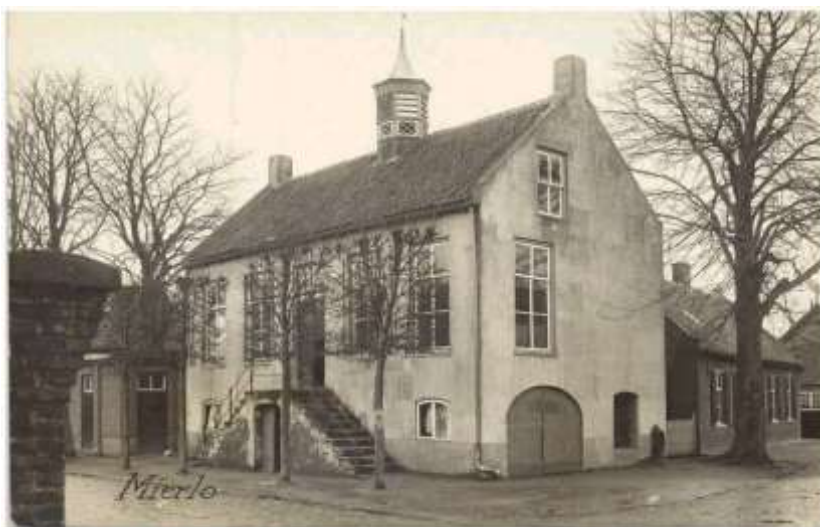
Het Oude Raadhuis van Mierlo