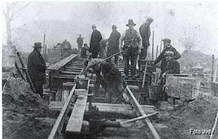
Het verhogen van de trambrug

in 1906 de lijn exploiteren. Door toedoen van o.a. de stoombootmaatschappij werd men genoodzaakt om de brug ca.1 meter te verhogen. Deze werd er met soortgelijke stenen opgemetseld, maar is nog goed te zien. Door de concurrentie van dezelfde stoombootmaatschappij en het sterk opkomende autobusbedrijf Spierings (het latere Ehad en thans Bergerhof) werd de exploitatie steeds moeilijker.