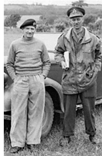
Links: Montgomery en rechts: Dempsey

die opperbevelhebber was van het geallieerde leger, kwam in het klooster op de thee. Dat hij ook nog belangrijker zaken te bespreken had spreekt van zelf. De bevelhebber van het Britse leger veldmaarschalk Montgomery was er ook. Dagelijks hield hij inspecties. Zo kunnen we toch spreken van gerenommeerde namen die Mierlo en ons klooster bezochten. Geruime tijd heeft het klooster dienst gedaan voor opvang van 100 evacuees uit Mierlo-Hout en Helmond. Vanuit Nijmegen werden er maar liefst 500 vluchtelingen op één middag opgevangen. Vanuit Venray kwamen er ook nog eens 100 vluchtelingen bij. Op 12 oktober 1944 bracht Prins Bernhard met de Engelse koning een bezoek aan het klooster. Als voorbereiding op de gevechtsacties voor het behoud van de twee bruggen over het Eindhovens kanaal werd er in 1944 een Engels lazaret (noodhospitaal) ingericht. Een zeer indrukwekkend gebeuren vond plaats in de kerstnacht van 24