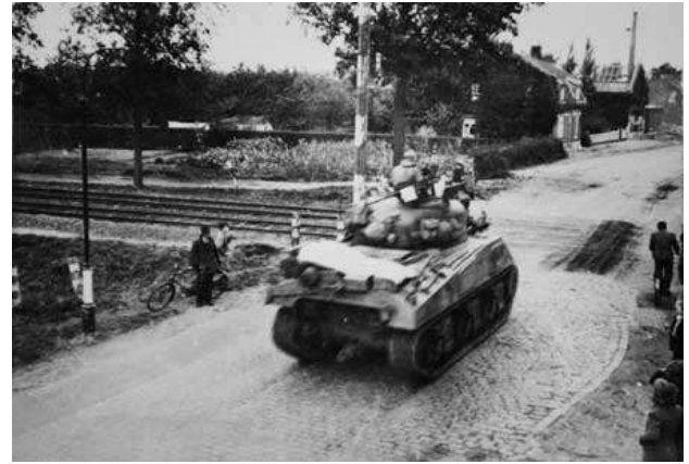
Nadat het Duitse verzet gebroken was kon de Engelse infanterie over de spoorlijn de opmars naar Helmond vervolgen.

Uiteindelijk wisten de Engelsen ook deze post te overwinnen en kon de opmars richting Helmond worden voortgezet. Mierlo-Hout was op 22 september bevrijdt. Helmond moest nog even wachten aangezien de Duitsers de bruggen allemaal hadden opgeblazen zodat de Engelsen er niet overheen konden. Pas op 25 september kon in Helmond de bevrijdingsvlag worden uitgestoken.