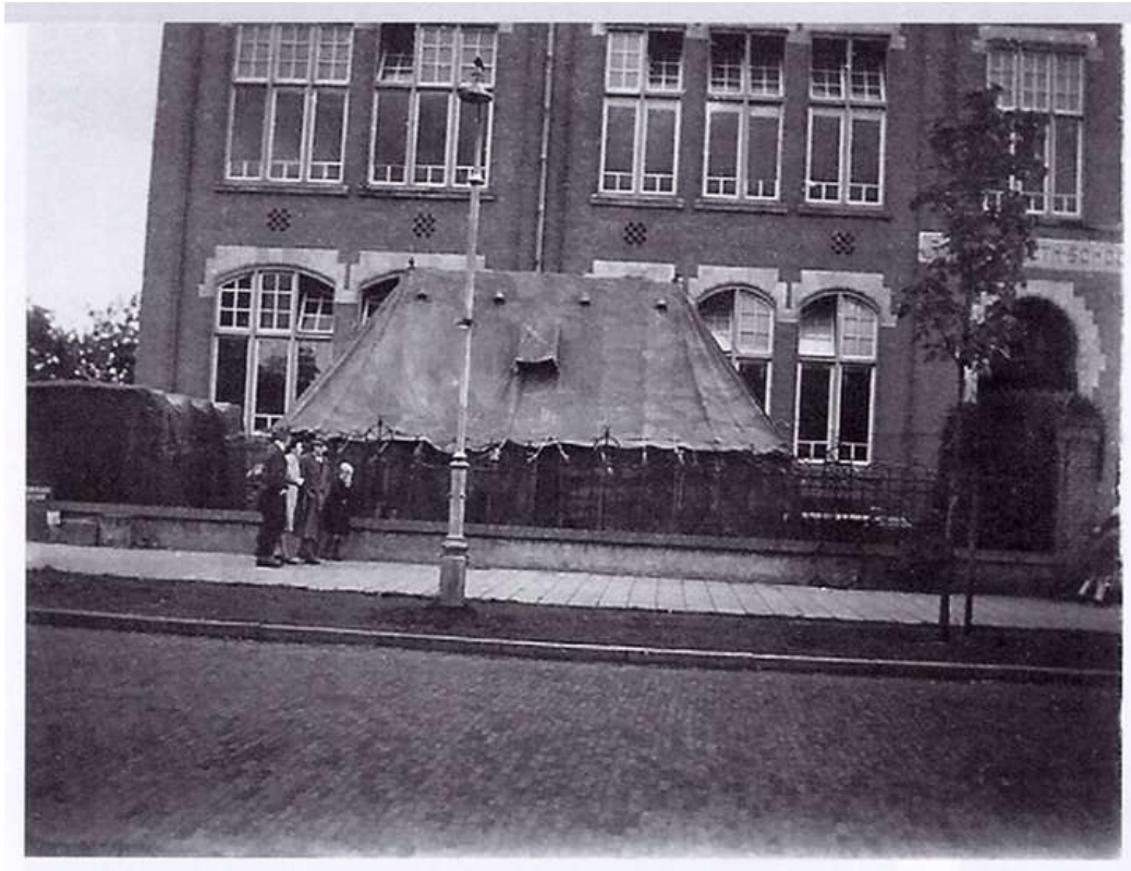
Brits noodhospitaal voor de Nazarethschool, 1944

In de oorlogsjaren heeft de school nogal te kampen gehad met huisvestingsproblemen. Eerst door inkwartiering van Duitse legeronderdelen en later door het Engelse leger dat er een noodhospitaal inrichtte. Om toch onderwijs te kunnen geven, moest men steeds elders ruimte zoeken.