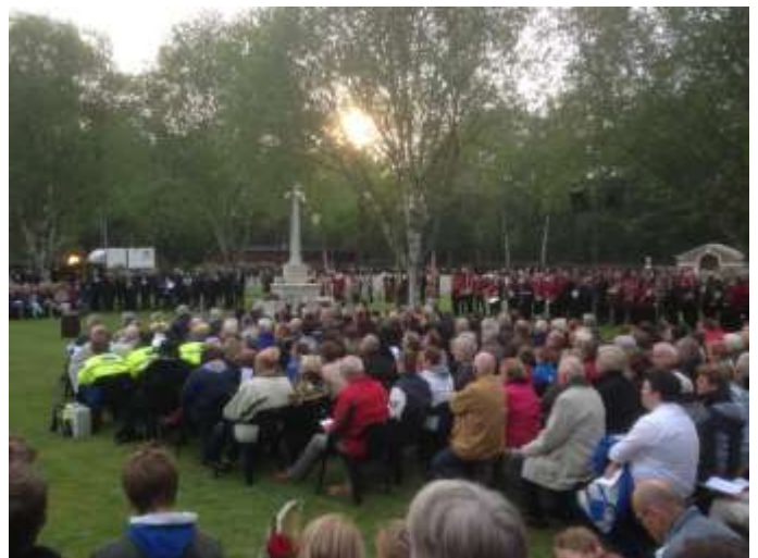
Dodenherdenking op 4 mei

aanwezig. De aanwezigheid van veel jeugdigen geeft aan dat het herdenken van de slachtoffers van de oorlog nog voortleeft en dat we bewust zijn van het feit dat we alleen in onze vrijheid kunnen leven door de opofferingsgezindheid van anderen.