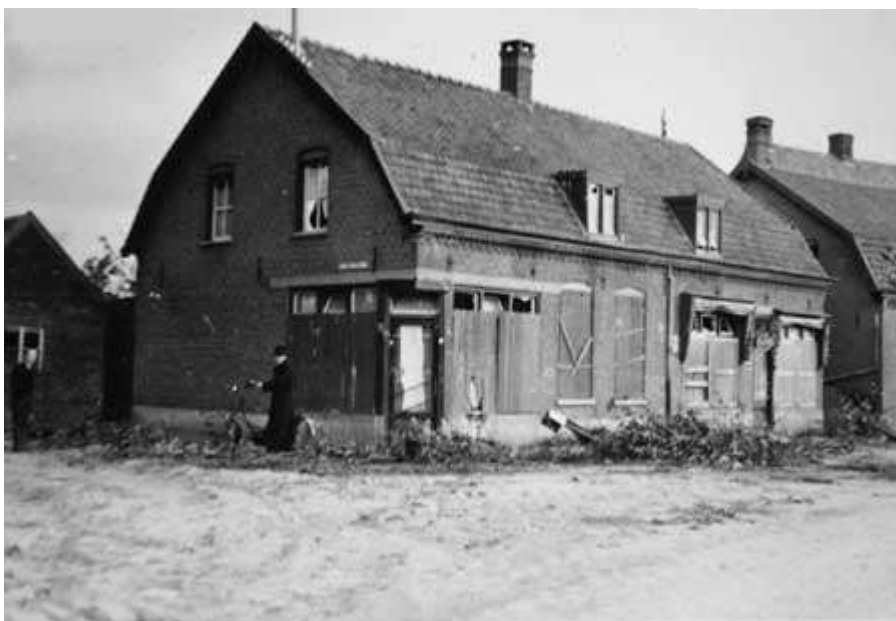
dichtgetimmerde schoenwinkel van Coolen op 22 september 1944. Voor de winkel nog was restanten van de bomengalerij.

Veel gebouwen in de omgeving hebben van die gevechten veel te lijden gehad. Bijvoorbeeld de schoenwinkel van Coolen op de hoek van de Hoofdstraat en de Parallelweg. Daar waar nu de Houtse Bazaar in gevestigd is. De winkel was door de Duitser in de oorlog geplunderd en beschadigd. De bomengalerij voor de winkel was door de terugtrekkende Duitse pantservoertuigen omver gereden en alle winkelruiten waren gesneuveld.