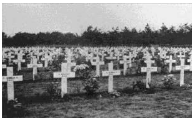
Oorlogskerkhof in de beginjaren

Bij de vuurgevechten en schermutselingen in de naaste omgeving van Geldrop en Mierlo vielen er vele doden. Zowel aan de zijde van de geallieerden als de Duitsers waren er doden te betreuren. Vaak was er geen tijd om de slachtoffers op een waardige manier te begraven en kregen zij een noodbegrafing ter plaatse. Later werden her en der de stoffelijke resten weer opgegraven en in Mierlo herbegraven. Zo lagen er Duitsers en andere nationaliteiten begraven. De Duitse