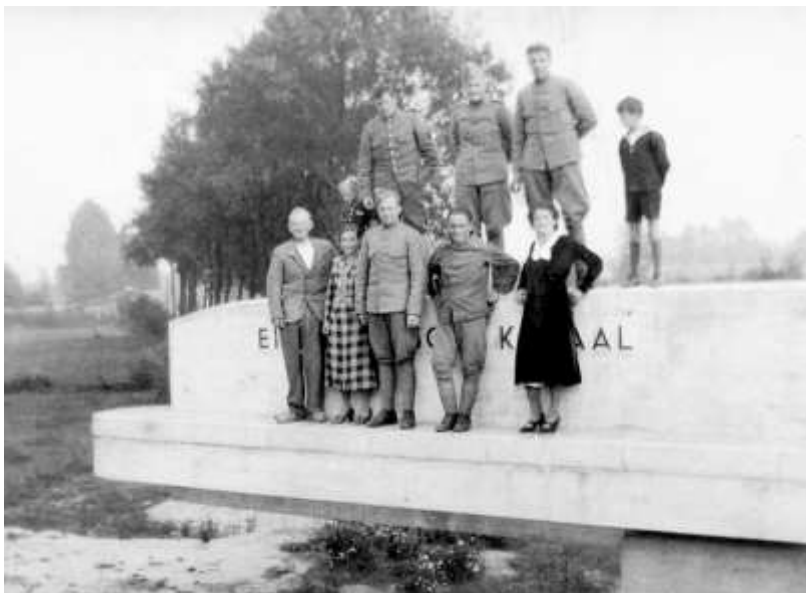
Soldaten en burgers op de Nieuwe brug die nog aangesloten moet worden op de weg.