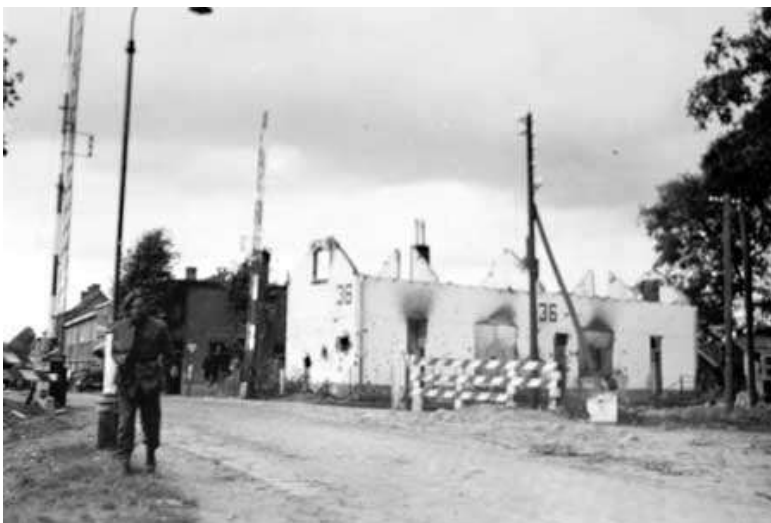
Wachtpost 36 bij de spoorwegovergang in de Hoofdstraat werd op 22 september in brand geschoten en brandde volledig uit.

Een belangrijke plek was de spoorwegovergang in de Hoofdstraat. De Duitsers hebben stevig ingezet om de Engelsen hier tegen te houden, nadat dat bij het Eindhovens kanaal niet gelukt was. Er werd een zware strijd geleverd, waarbij onder ander de spoorwegpost nr. 36 vernield werd. Mitrailleurvuur klonk van beide kanten en er werden vele granaten afgevuurd. Slachtoffers konden niet uitblijven. Zwaar gewonden werden afgevoerd naar het (nood)ziekenhuis in Geldrop, licht gewonden werden in woningen in de omgeving verzorgd. De doden