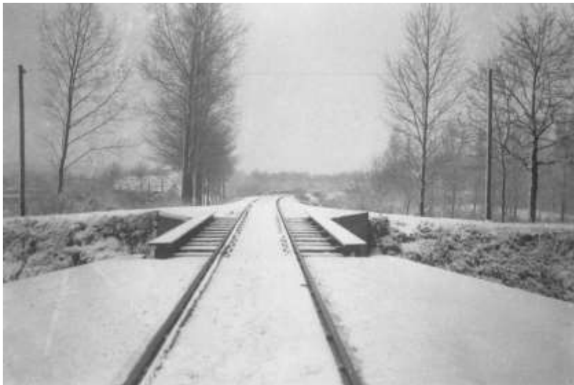
De trambrug in een winterslandschap

verdedigingslinie liep vanaf de trambrug tot aan de 'Nieuwe brug'. Bij het binnenkomen van de geallieerden tijdens de bevrijding in 1944 werd van hieruit tegenstand geboden.