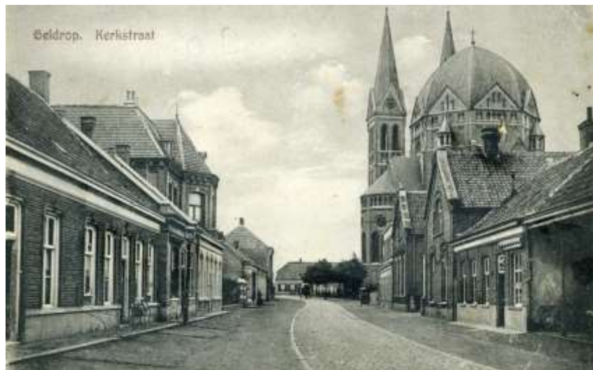
Kerkstraat, op rechtsvoor café Bosch, daarnaast de oude jongensschool

In 1939, dus vóór de bezetting, waren er al enkele levensmiddelen op de bon (o.a. suiker). Er was dus ook een distributiekantoor dat gevestigd was in de tramremise op de Heuvel, in het pand waar ze nu een restaurant aan het inrichten zijn links, van het oude gemeentehuis. Op 13 januari 1941 verhuisde het distributiekantoor naar de oude school in de Kerkstraat (nu Heuvel).