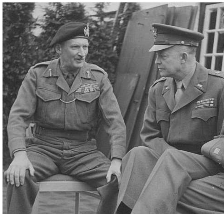
Bernard Montgomery (l) in gesprek met Dwight Eisenhower

commandant der B.S., was zijn vertrouwensman en hield zijn woning in de gaten. Daarnaast bewees hij Montgomery vele andere diensten. Hij gaf opdrachten door via geheime verbindingen. Deze ex-commandant is 31 jaar geleden in Geldrop overleden. Het werd uiteraard wel geheim gehouden dat in deze villa het hoofdkwartier van het geallieerde leger gevestigd was. Er was ook uiterlijk geen bewaking, maar uit gegevens van die ex-commandant bleek dat, wanneer het donker was, de gevechtswagens een cordon rondom het huis trokken.