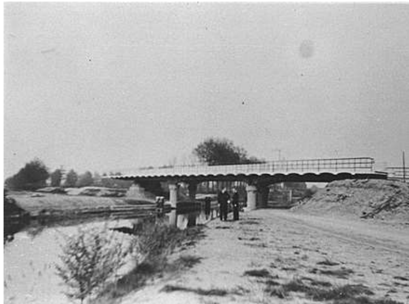
Aan de linkerzijde van de brug zit nog geen talud

in Mierlo-Hout aan de spoor-weg-overgang zoveel tegenstand boden, moesten de Engelsen weer terugtrekken hergroeperen. Bij deze en andere gevechtsacties werd vanaf de Oudvense brug met mitrailleurs en granaten geschoten. Bij een noodlottig treffen van waarschijnlijk een of meerdere granaten zijn op tragische wijze vele slachtoffers gemaakt. Na de oorlog werd met paard en kar en gebruikmaking van vele kruiwagens de grond van het talud bij de trambrug afgegraven en verplaatst naar de in aanleg zijnde nieuwe weg en nieuwe brug, zoals wij die nu nog kennen als "de Geldropseweg" met "de Neijbrug".